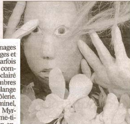
« Le Mioche », un spectacle de marionnettes qui raconte avec les enfants ce qu'est la guerre. (DR)