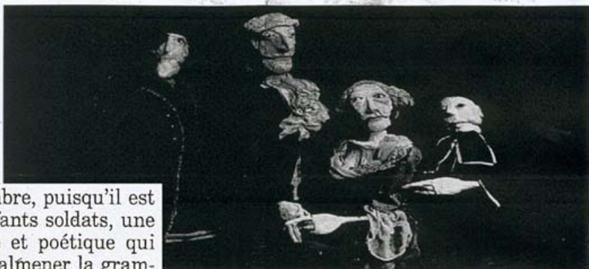
Les spectacles de marionnettes séduisent aussi bien les adultes que les enfants.

C'est désormais devenu une tradition pour les Strasbourgeois : avec le mois de mars, un an sur deux, viennent les Giboulées. Une pluie de pantins, de formes animées, d'ombres, d'objets plus ou moins identifiés, déferlent sur la ville. Le festival fête cette année sa 14 e édition. Son public, de plus en plus mordu, ne cesse de s'élargir. Est-ce lié à l'engagement général pour les formes contemporaines de la marionnette, qui draine chaque année des fidèles plus nombreux ? Toujours est-il que ces Giboulées sont doucement en train de prendre l'engorgement d'un rendez-vous international à l'égal des grands festivals de Puppets ou de