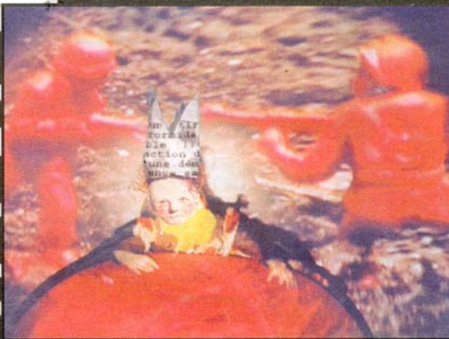
Le Mioche évoque la vie et des émotions d'un petit garçon pris en otage par une faction armée.

Il existe des histoires qu'il est impossible de raconter, tellement vraies et traumatisantes qu'aucun mot n'est capable de les traduire. Alors le silence s'installe. Par nécessité, par goût, par humanité, deux artistes ont décidé de prendre la parole. Avec leur propre langage, celui de la peinture, du théâtre de marionnettes, de la création sonore et verbale, ils sont devenus les interprètes de la vie et des émotions d'un petit garçon pris en otage par une faction armée. Sa vie, ils l'ont