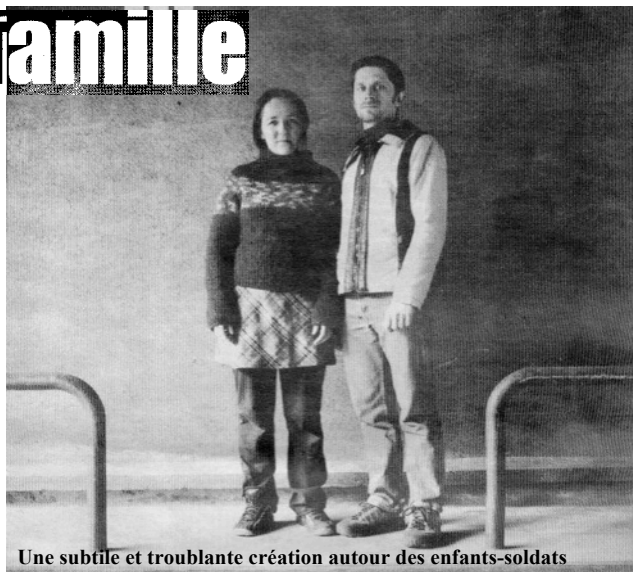
Une subtile et troublante création autour des enfants-soldats